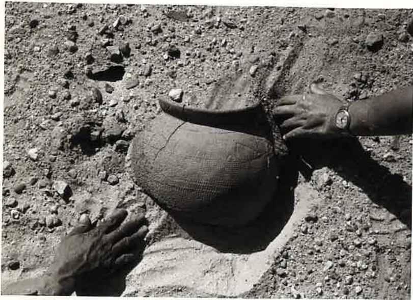
N° 17.- Mission ORZL.

Le crâne silicifié découvert par la mission aux abords de l'Ég. Koch.