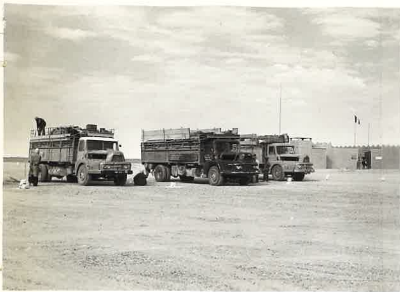
N° 4.- Mission ADDAX.

Un convoi civil venant de GAO contrôlé par la Gendarmerie à BORDJ-PEZZE.