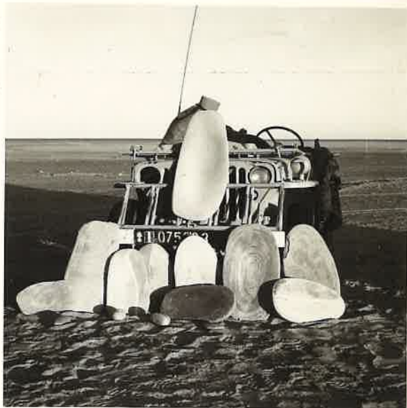
N° 14.- Mission ORYX.

Quelques beaux spécimens de meules de l'époque néolithique.