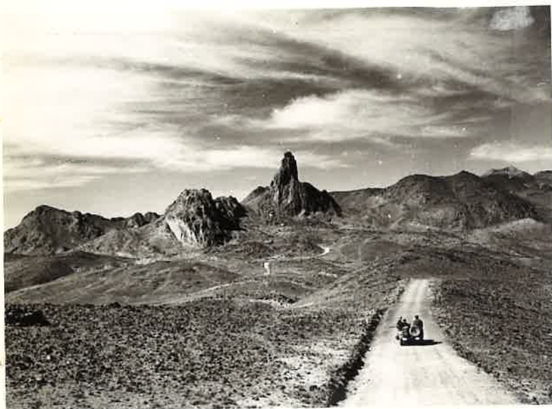
N° 8.- Mission ADDAN.