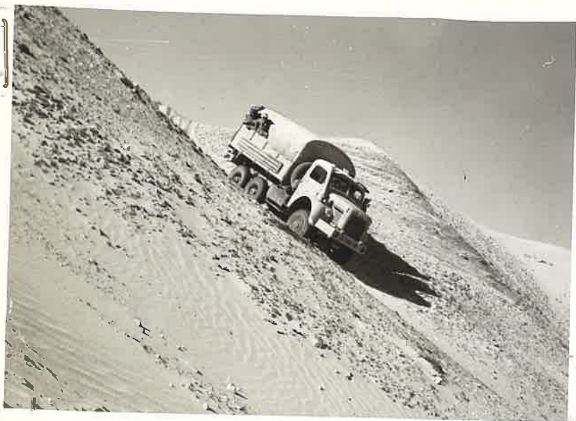
N° 10.- Mission ORYX

Vue d'une des 2 "garolles" de la mission dans un passage pittoresque.