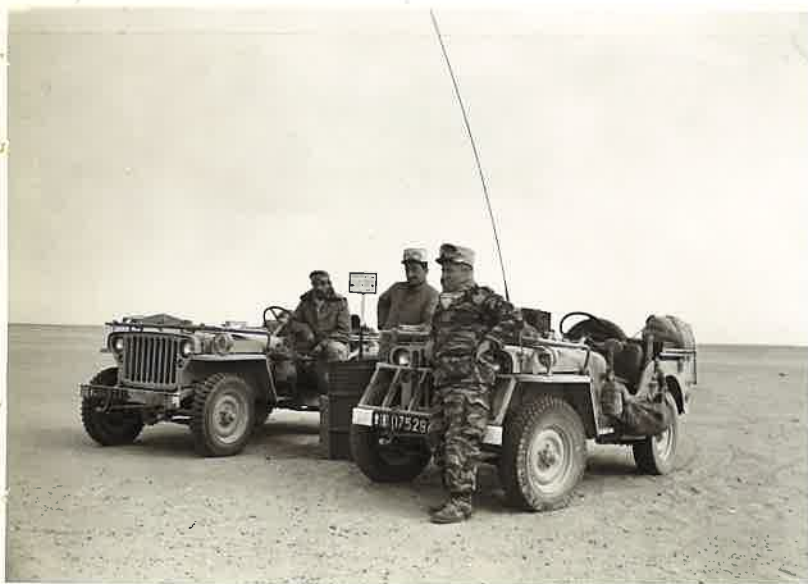
N° 9.- Mission GYX.

Viste à l'Assire (Hoggar) L'Entasse du Père de FOUCAULT.