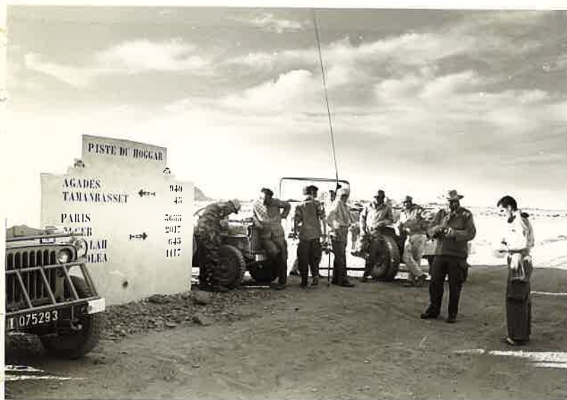
N° 6.- Mission ADDAX.

Reconnaissance à la frontière Franco-Italienne.