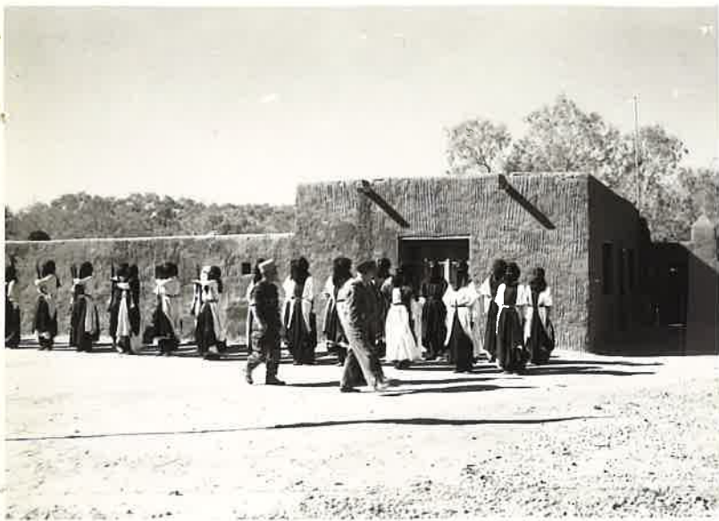
N° 7.- Mission ADDAN.