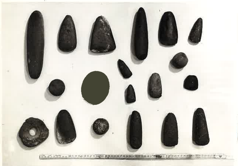
N° 18.- Mission ORZL.

La mission découvre un vase de l'époque préhistorique.