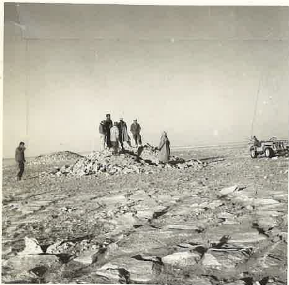
N° 13.- Mission ORYX.