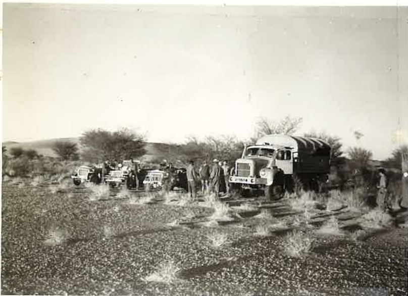
N° 5.- Mission ADDAX

Un convoi civil venant de GAO contrôlé par la Gendarmerie à BORDJ-PEZZE.